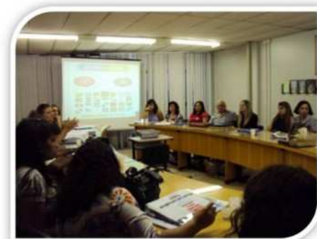
1ª Reunião Oficial da Agenda Territorial do DF - 2009