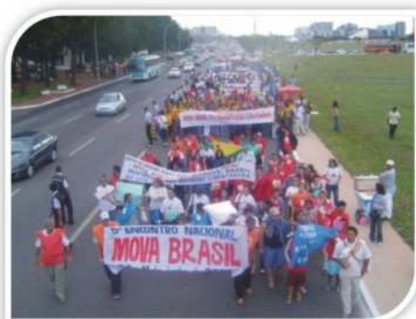
5º MOVA - Brasil Esplanada dos Ministérios - 2005