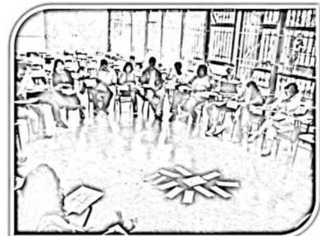
Reunião Ampliada do GTPA Fórum EJA/DF - 2010