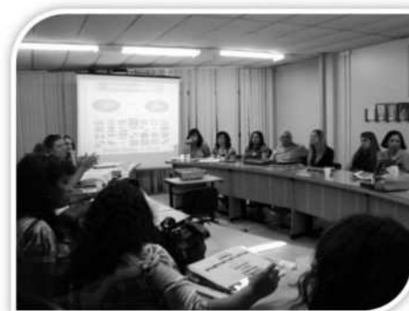
1ª Reunião Oficial da Agenda Territorial do DF - 2009