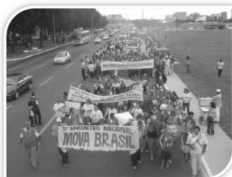
5º MOVA - Brasil Esplanada dos Ministérios - 2005