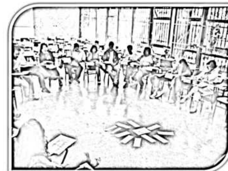
Reunião Ampliada do GTPA Fórum EJA/DF - 2010