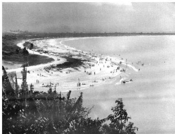
PRAIA DE CAMBURI