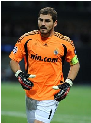
Iker Casillas Spain