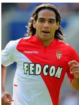
Radamel Falcao Colombia