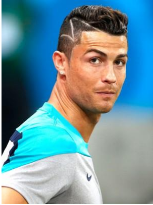
Cristiano Ronaldo Portugal