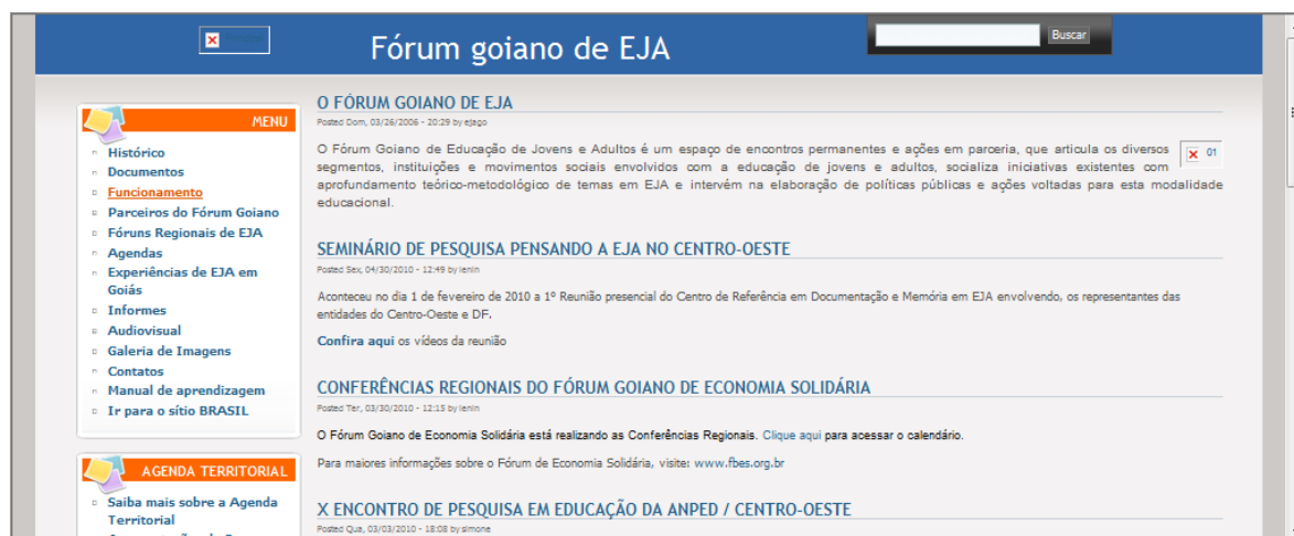
Portal do Fórum Goiano de EJA em agosto/2010