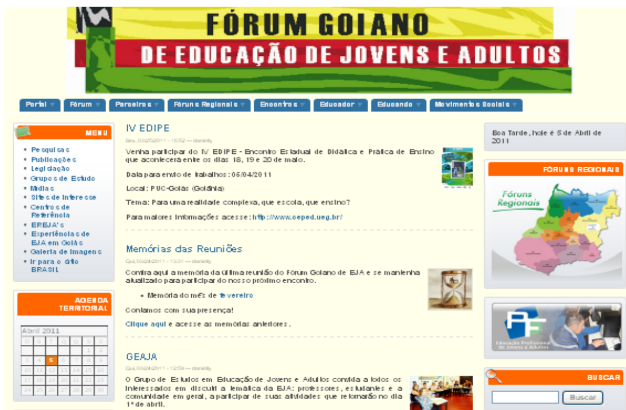
Portal do Fórum Goiano de EJA em 5/4/2011

Esta reorganização adveio de um recurso recebido do governo federal a partir do projeto que previa a contratação de um técnico em informática e dois bolsistas. Com a chegada do recurso, foram realizadas várias reuniões com os membros do Fórum, a fim de definir como seria a reorganização do espaço do Portal. Em outubro/2010, após mapear o que havia no site, buscar sugestões em outros sites e dialogar com os membros do Fórum, foi construído um boneco de como deveria ficar a página, o qual