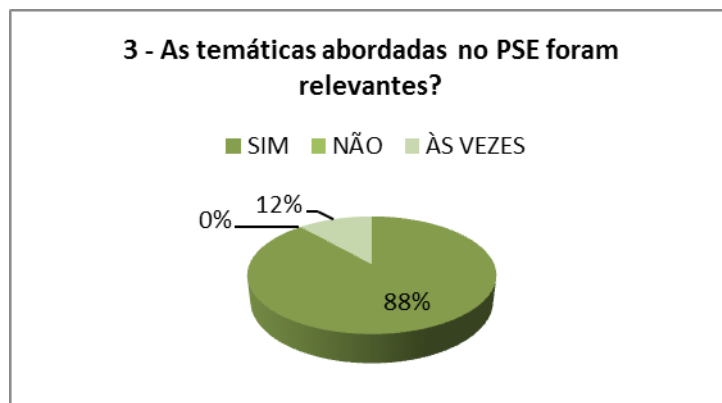
Gráfico nº 03. Extraído do Relatório do PSE/2014.

incentivam para um trabalho com mais ânimo. Julgaram que os assuntos foram importantes e esclarecedores enriquecendo o conhecimento de todos os participantes. Consideraram que o desenvolvimento do projeto foi de suma importância para o bom desempenho da instituição escolar, pois todos se conscientizaram da importância de se pensar na qualidade da educação no espaço escolar.