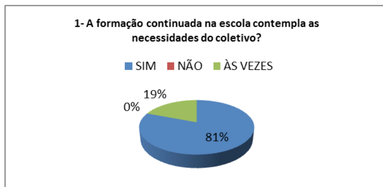
Gráfico nº 1. Extraído do Relatório do PSE/2014.

Na pergunta nº 02: O projeto contribui para o processo ensino-aprendizagem? A maioria respondeu “sim”, afirmando que o mesmo foi o caminho para se chegar à informação, ao debate, à interação, às trocas de experiências e de conhecimento. Talvez seja este um dos fatores que mais contribuem no ensino e aprendizagem, segundo os participantes. Os temas são considerados de fundamental importância para os professores. Segundo os professores o projeto contribui porque são compartilhadas as experiências em sala de aula, as reflexões, as sugestões, enfim, melhora-se a prática pedagógica. As discussões contribuem para a tomada de consciência da realidade da escola, favorecendo o processo ensino aprendizagem. Foi justificado ainda que os participantes aprendem e evoluem com todos, pois as reflexões e análises ajudam a pensar e repensar novos meios nas práticas docentes, considerando que os avanços na educação dependem dos espaços de discussão e o PSE propicia essas discussões.