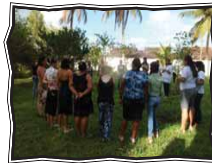
Atividade de organização do PEPP em Carpina (PE)