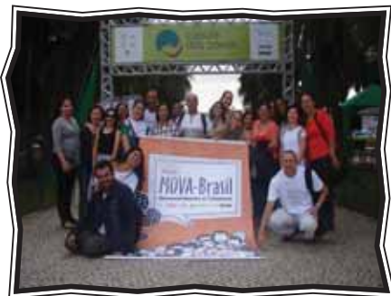
As equipes do Mova na Cúpula dos Povos

Durante dez dias, o Brasil foi palco de um momento de grande importância para todas as espécies de vida da Terra. Quase todos os países do mundo resolveram dar continuidade ao encontro iniciado em 1972, em Estocolmo (capital da Suécia) e depois em 1992, no Rio de Janeiro, com a ECO-92, para discutir os rumos do planeta. Trata-se da Rio+20, a Conferência das Nações Unidas sobre Desenvolvimento Sustentável.