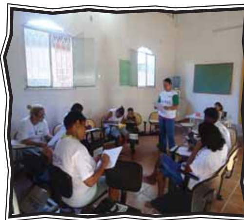
Atividades na sala de aula de Laudiceia

Como disse Paulo Freire, “a educação é, antes de tudo, um ato político”. E hoje eu defendo tudo o que acredito, sou uma pessoa política!