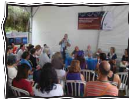
Representante da FUP/Mova em atividade autogestionada