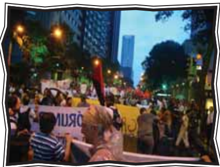
Caminhada reúne 80 mil pessoas

No dia 20 de junho, cerca de 80 mil pessoas, incluindo equipes dos polos do Projeto MOVA-Brasil, caminharam pela Avenida Rio Branco até o Teatro Municipal do Rio de Janeiro para anunciar ao mundo o compromisso com a justiça social e ambiental e com a luta organizada dos povos para sua emancipação.