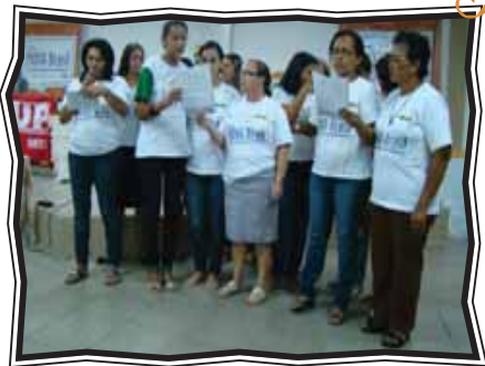
Formação de Monitores e Coordenadores (RN)