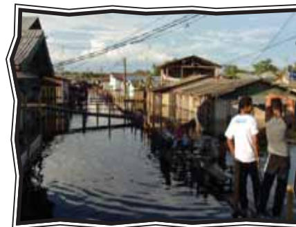
Visita da equipe do polo às áreas alagoadas em Manacapuru (AM)