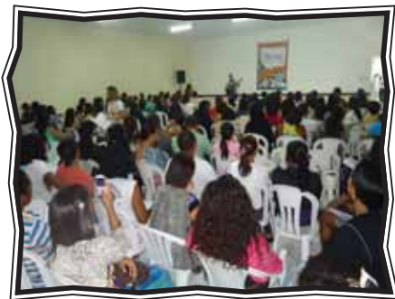
Formação Continuada em Feira de Santana

Especialmente nos Núcleos Cruz das Almas e Serra Preta as atividades estenderam-se por