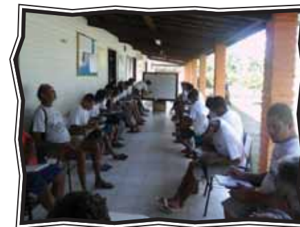
Turma do Caponga (CE)

inaugurais das turmas do Projeto aconteceram de diversas formas, mas, no geral, a programação contou sempre com a apresentação do Projeto, incluindo uma prévia sobre sua proposta metodológica. Em clima festivo, os participantes vivenciaram o primeiro dia com direito a depoimentos e fortalecendo vínculos que serão fundamentais no processo educativo durante os meses do Projeto na comunidade.