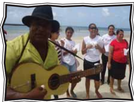
Atividade de Leitura do Mundo em Marechal Deodoro (AL)

Na Formação Inicial estiveram presentes autoridades locais como o deputado federal Judson Cabral, o prefeito do município de Marechal Deodoro, Cristiano Matheus, e outras pessoas que prestigiaram e ressaltaram o apoio integral ao Projeto.