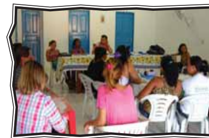
Formação semanal de monitores de Itacoatiara (AM)

O Núcleo, juntamente com seus parceiros, realizou, no dia 26 de maio deste ano, o Mova sua Cidadania . Trata-se de um conjunto de ações como palestras, corte de cabelo, apresentações culturais, atendimento médico e expedição de documentos. Tudo faz parte das atividades da Festa da Escola Cidadã prevista pelo Projeto.