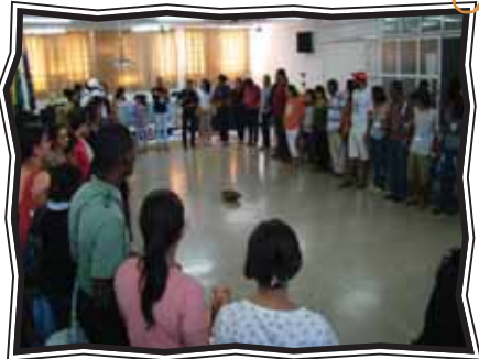
Seminário de Educação do Campo em Montes Claros (MG)

Nada será como antes: iniciando os trabalhos, fortalecendo parcerias, projetando novos horizontes