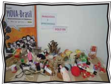
Exposição de brinquedos na Formação Inicial em Extremoz (RN)

O trabalho dos brinquedos e brincadeiras foi considerado por todos os participantes uma temática envolvente por ter despertado a alegria que revelou sonhos de um mundo melhor, permitindo uma participação efetiva nas atividades, tornando relevantes as discussões de resgate cultural da infância na alfabetização com os jovens, adultos e idosos – cujo fio condutor foi o diálogo pautado na realidade existente nas salas de aula.