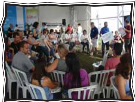
Equipes dos polos em plenária da Cúpula dos Povos

Foi no contexto da Rio+20 que o Projeto MOVA-Brasil realizou sua 2ª Formação Continuada de Coordenação de Polo. O encontro aconteceu entre os dias 18 e 22 de junho, na cidade do Rio de Janeiro, e as equipes dos polos participaram das discussões mundiais sobre a sustentabilidade do planeta e sobre o processo de alfabetização de jovens, adultos e idosos. A pauta incluiu a participação da direção do Projeto, do comitê gestor, dos articuladores sociais, bem como o processo de construção do Projeto Eco-Político-Pedagógico (PEPP) e o trabalho com almanaque nos diferentes estágios do processo de aquisição da leitura e da escrita.