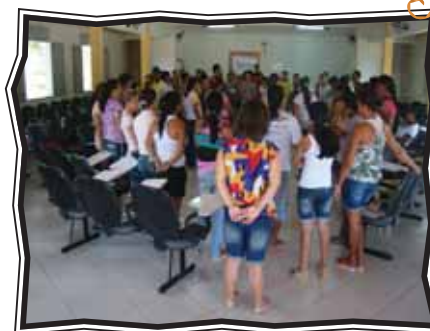
Formação Inicial de Monitores e Coordenadores em Lagarto (SE)