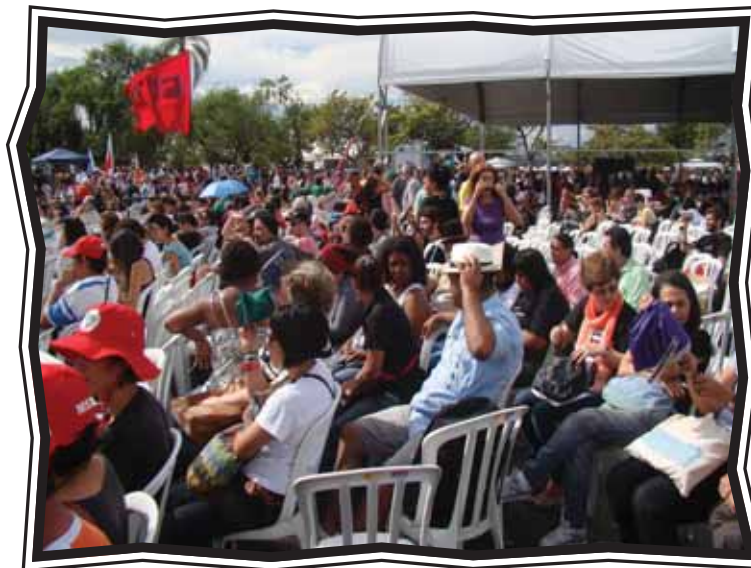
A participação do Mova na agenda de lutas

Por fim, as equipes dos Polos também participaram da última atividade da Cúpula dos Povos, a Assembleia dos Povos, realizada no dia 22 de junho, no período da manhã. Neste momento, foram apresentadas as sínteses das deliberações de cada plenária que ocorreram durante o evento, bem como as propostas de luta para os movimentos sociais continuarem construindo um planeta mais sustentável com desenvolvimento econômico, justiça social e ambiental para todas e todos.