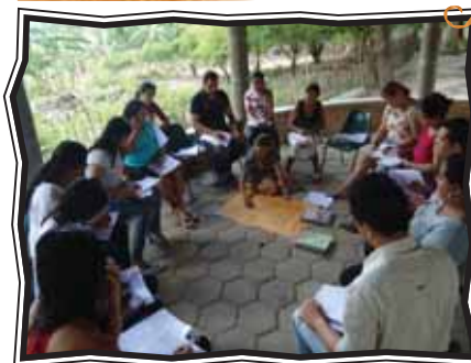
Formação Inicial de Monitores e Coordenadores em Caucaia (CE)