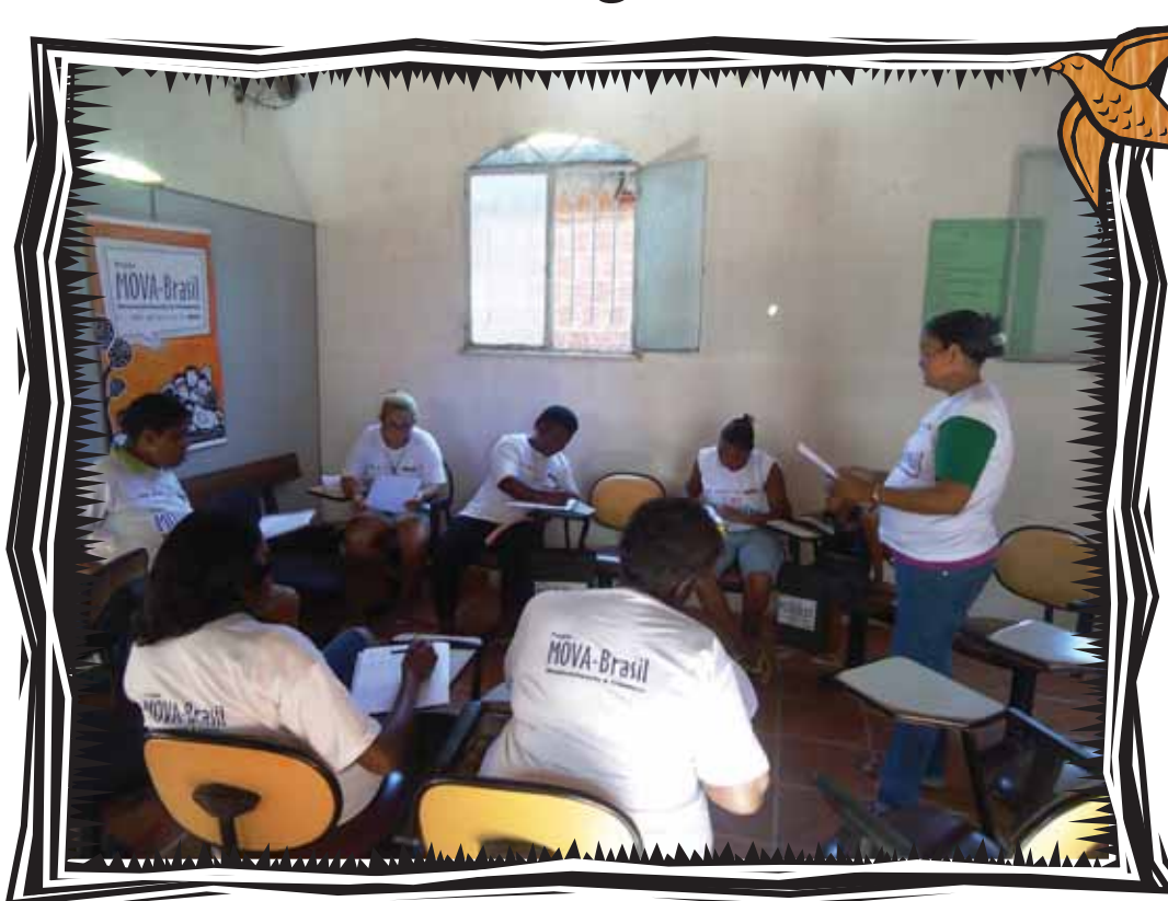
Sala de alfabetização em Nova Iguaçu (RJ)

Quando a vida da escola se integra à vida do Movimento temos, pois, não a construção de uma nova escola, mas a possibilidade de que a escola seja mais do que escola, porque será um lugar movido pelos valores de uma grande luta, uma luta de vida por um fio, fio de raiz, de vida inteira, em todos os sentidos. (CALDART, 2004, p. 395).