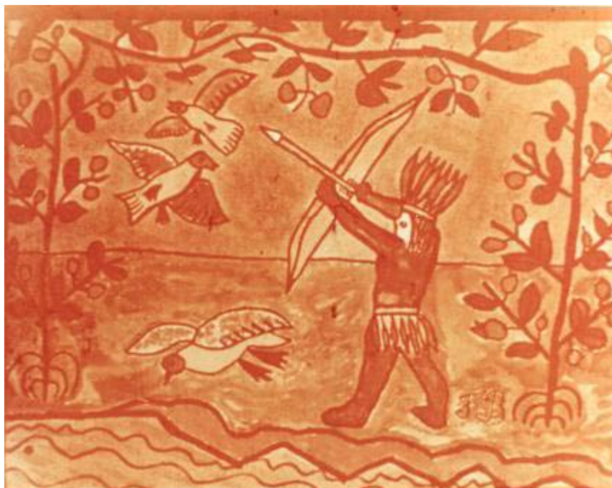
Ficha 3: O caçador iletrado

No apêndice do livro Educação como prática da liberdade , elaborado após as experiências da década de 1960, 8 Paulo Freire apresenta a discussão ocorrida em círculos de cultura a partir das fichas e não nega a existência de cultura e de educação nas sociedades indígenas. Diz que o caçador e o índio estão em “fases histórico-culturais” distintas, ou seja, o homem iletrado vive oprimido; com a alfabetização o homem passa a pertencer a uma cultura letrada e poderá deixar de ser oprimido, tornando-se sujeito de sua história.