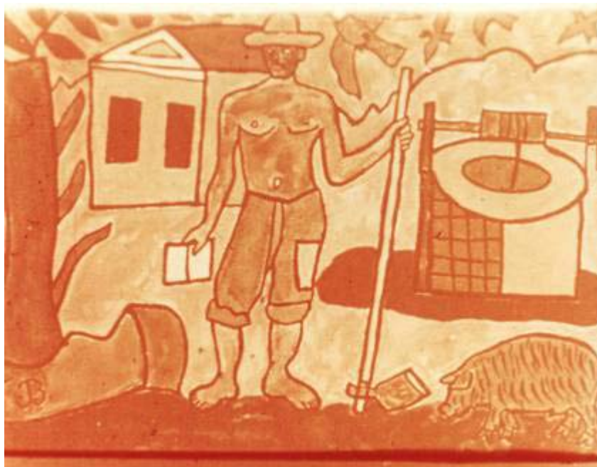
Ficha 2: A natureza – mediadora da comunicação entre o homem e o mundo da cultura