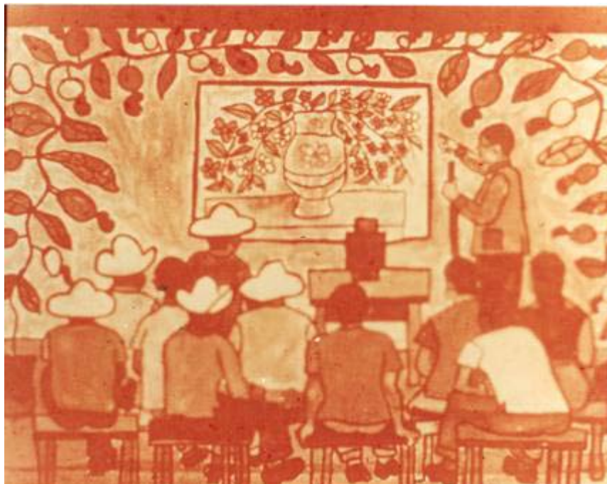
Ficha 10: O círculo de cultura

Nesta última situação, está presente a valorização da cultura letrada para a emancipação do povo que, através da comunicação, baseada no diálogo, é educada e simultaneamente educa. A identidade nacional, portanto, segue o pensamento otimista da educação. A democratização da cultura é um instrumento que permitirá a todos compreender o contexto histórico em que estão inseridos. Essa visão era recorrente durante a década de 1960, marcado pela efervescência política, social e cultural. Foi um momento no qual se questionava o modo de ser brasileiro, de viver e participar na história política e cultural do país. O objetivo principal era transformar a cultura brasileira e, através dela, pelas mãos do povo, transformar a ordem das relações de poder e a própria vida do país – projeto, como se sabe, interrompido bruscamente após o golpe militar de 31 de março de 1964.