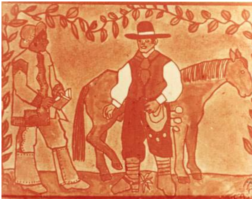
Ficha 9: O gaúcho e o vaqueiro

Suas representações remetem às descrições literárias de José de Alencar e Euclides da Cunha, reforçando os tipos humanos criados a partir da relação com o cenário da paisagem cultural, solenizadas na iconografia de Percy Lau 9 e nos objetos colecionados do Museu Nacional, no Rio de Janeiro. O gaúcho e o vaqueiro , segundo as fontes literárias e iconográficas, diferenciam-se pela combinação étnica, pelo caráter e pela própria vestimenta, e principalmente pelas habilidades e técnicas utilizadas face ao imperativo do meio físico. Essas diferenciações são também apresentadas na ficha 9, tornando possível estabelecer relações de convergência de representações, suas similaridades e detectar matrizes ou imagens paradigmáticas.