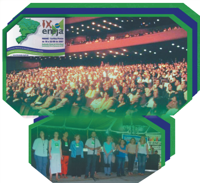
Ainda em Recife o FÓRUM Paranaense de EJA se desafiou a coordenar a construção coletiva do IX ENEJA VIII ENEJA - 2007

www.forumeja.org.br www.forumeja.org.br www.forumeja.org.br