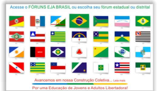
Fevereiro de 2006 - org