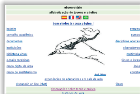
Outubro de 1998