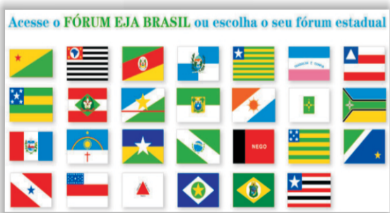
Setembro de 2005 - unb