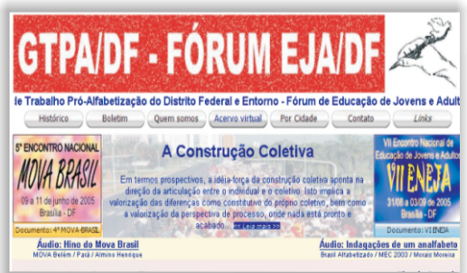
Março de 2005 - unb