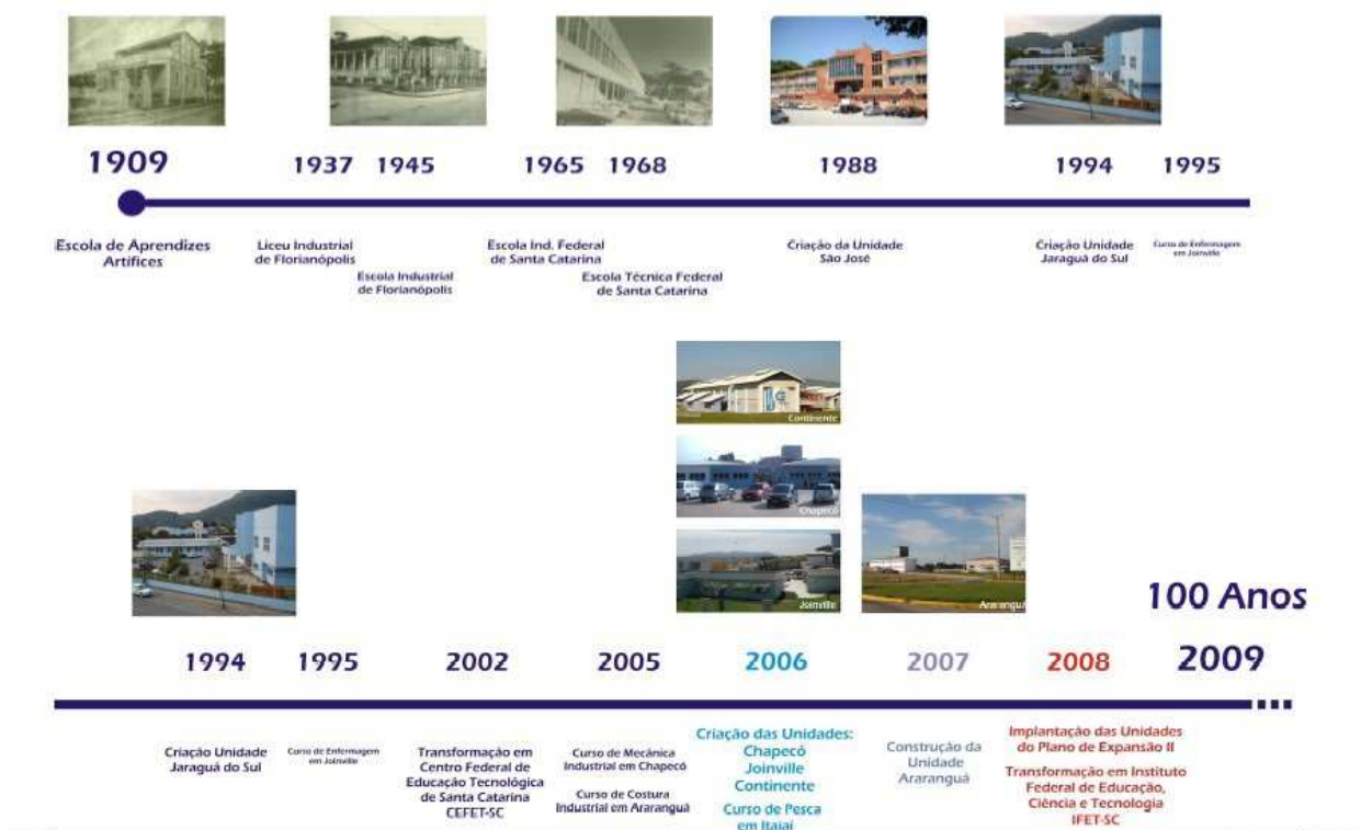
Figura 2 – Evolução Histórica do IF-SC.