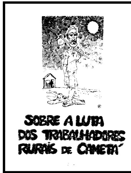
Figura 02: Capa da Revista do STR-Cametá, 2004.