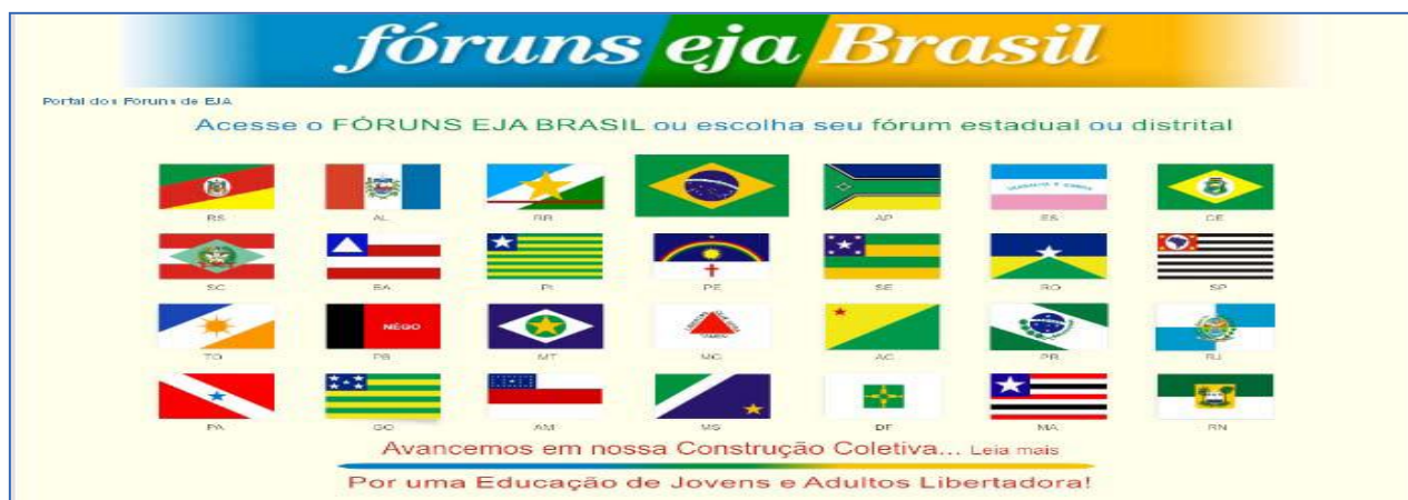
Imagem 1: Portal dos Fóruns de EJA Brasil

do caráter informativo, o Portal possibilita a comunicação entre as pessoas, fortalecendo uma rede de trocas onde se favorece o diálogo, surgindo a possibilidade de produção de novos conhecimentos acerca das problemáticas da Educação de Jovens e Adultos. (PORTAL FÓRUNS EJA BRASIL, 2014).