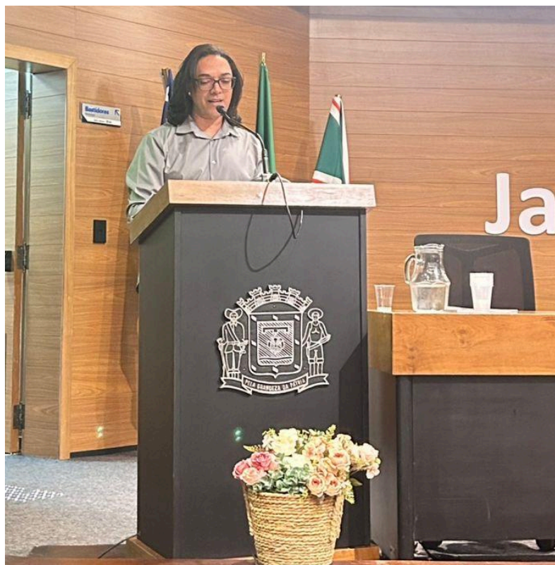
Figura 1- Cerimônia de abertura na Câmara Municipal.