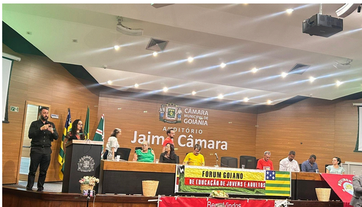
Figura 2- Mesa de autoridades da primeira noite do evento.