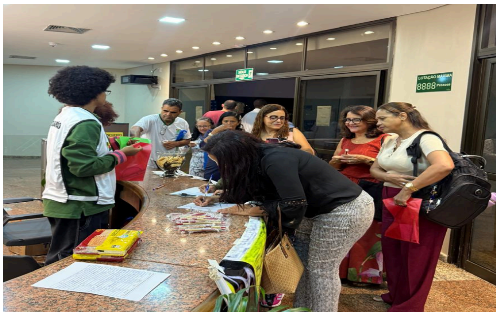
Figura 4- estudantes de pedagogia da UFG na acolhida com a distribuição dos brindes e do café.