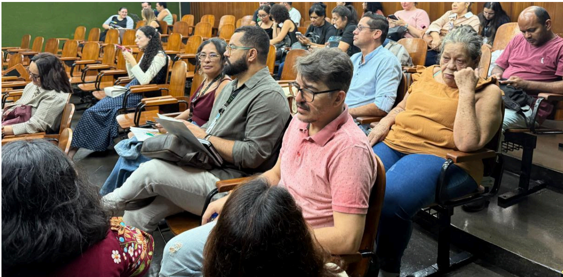
Figura 2- parte da plateia da segunda noite do encontro no IFG-Goiânia.