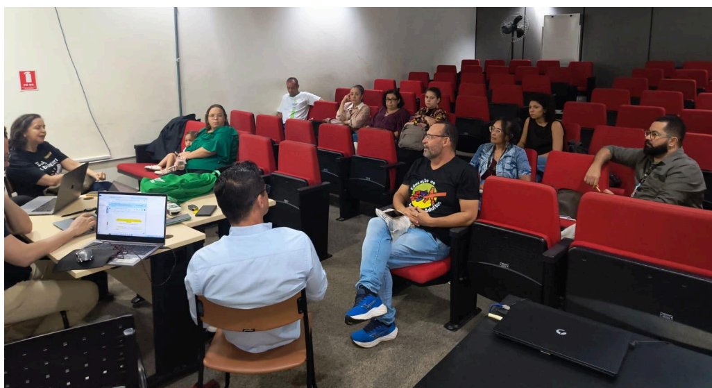
Figura 3- Eixo temático-1 da segunda noite do evento.