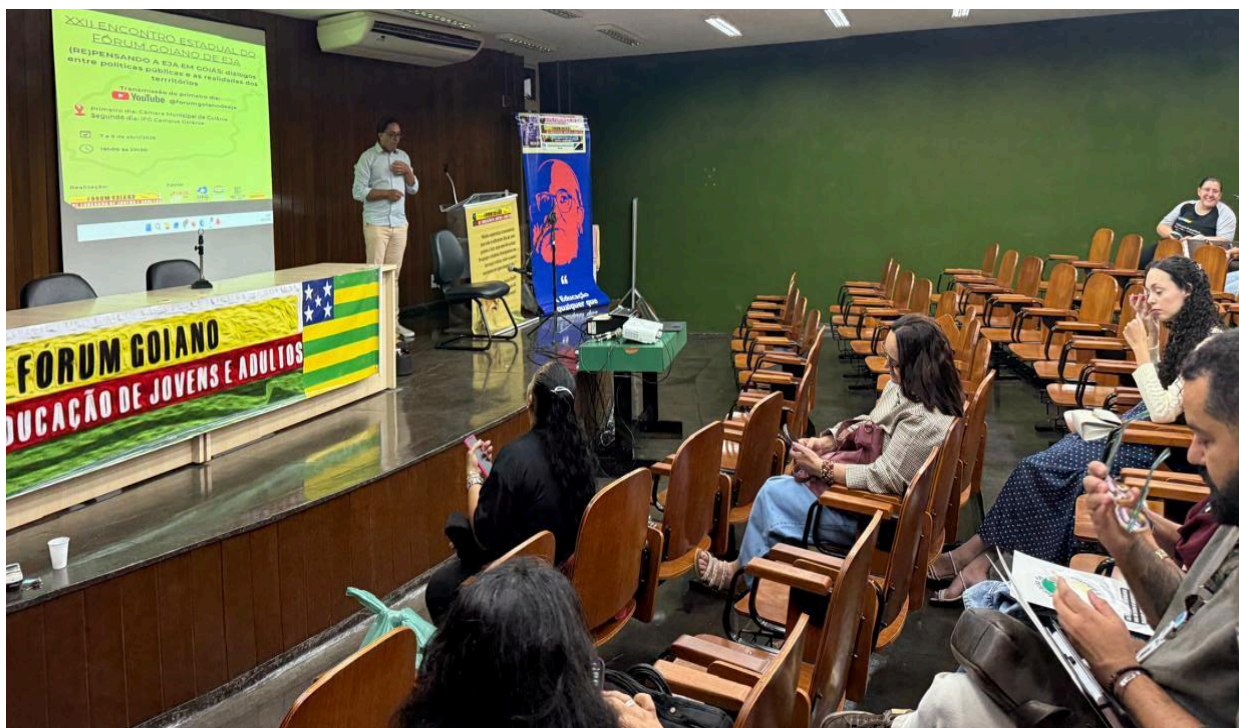
Figura 1- Cerimônia de abertura da segunda noite no IFG Goiânia.