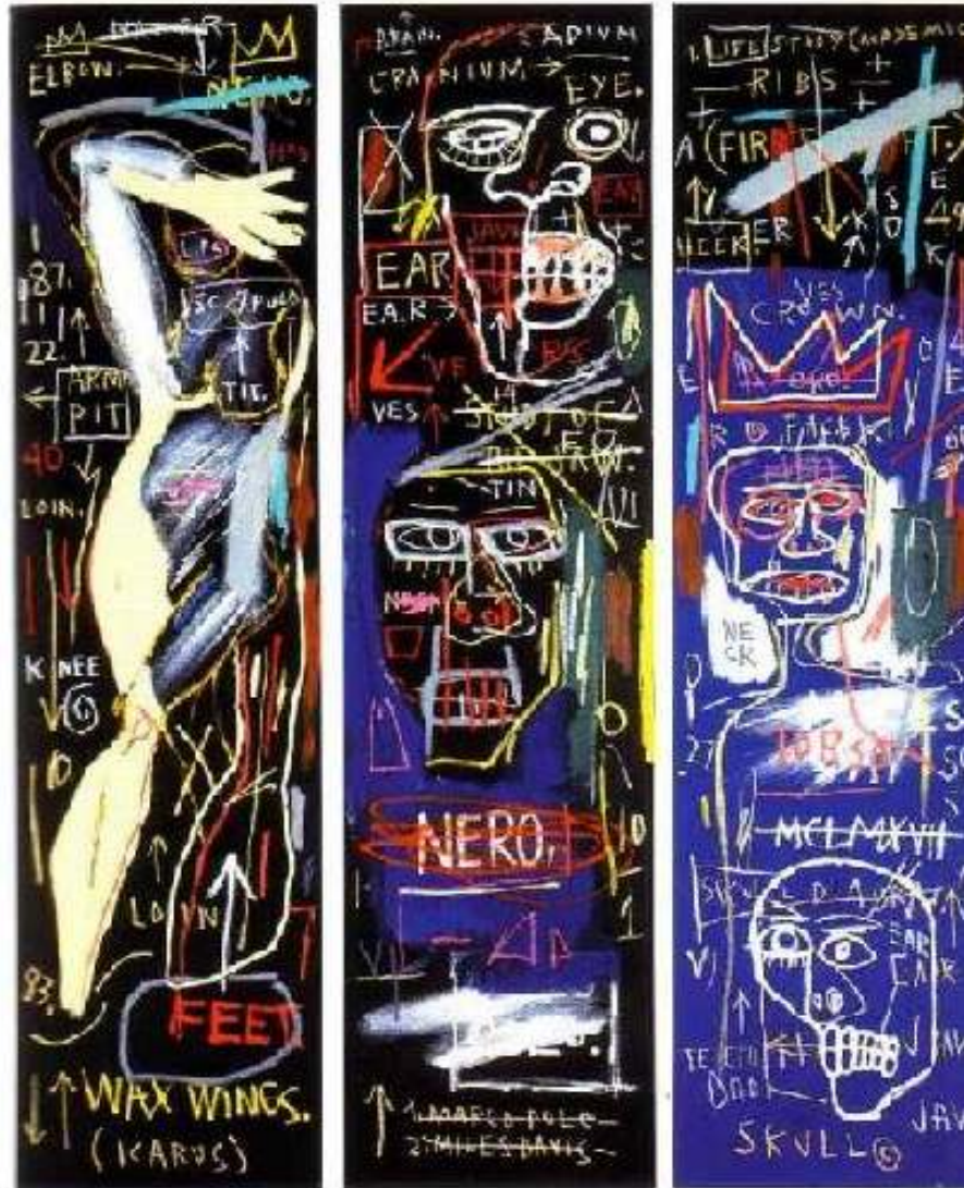
Basquiat, 1982, sem título